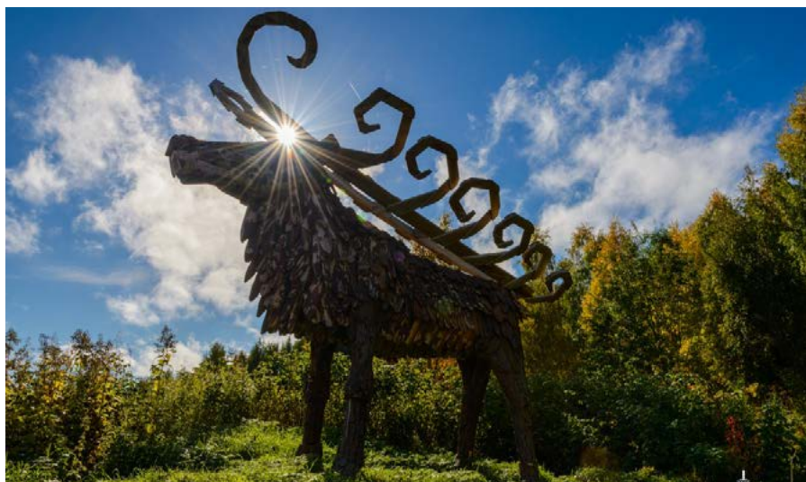
↑ Деревянный пинежский олень со скифскими рогами, выполненный из горбыля и досок, в парке «Голубино»

И это замечательно, т.к. добавит эмоций сегодняшнему приключению. Переходя из зала в зал, сравните узоры, которые природа создала из камней. Обратите внимание на дно ручья — там причудливые песчаные орнаменты, которые вытачивает вода. Зимой здесь «вырастают» высокие ледяные стелы, stalactites и stalagmites. Но и летом подземных чудес достаточно. Направляйте налобный фонарик на стены, своды, внимательно смотрите вокруг — и обязательно обнаружите множество потрясающих воображение деталей загадочного подземного царства.