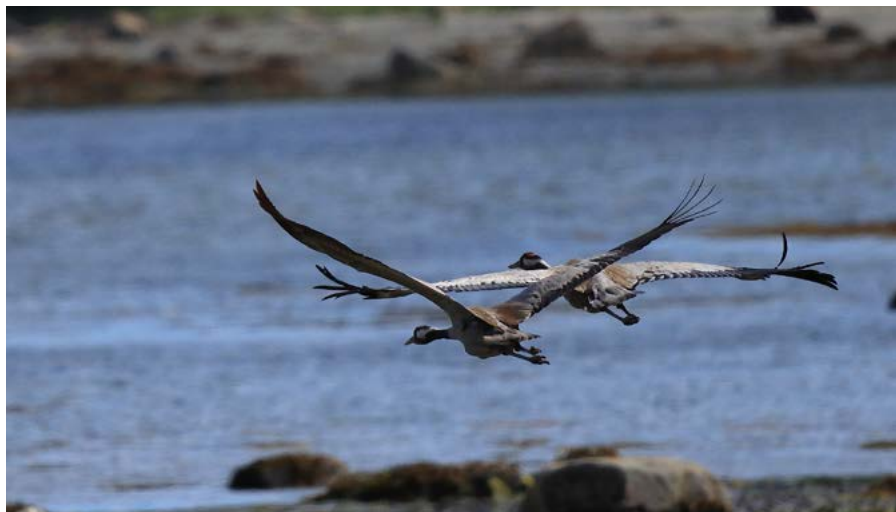
↑ Кандалакшинский заповедник — место обитания многих краснокнижных птиц

Пришвартуйтесь у Терского берега — настоящего геологического музея под открытым небом и места, где до сих пор живут потомки поморов, рыбацких и охотников, которые до сих пор чтут и сохраняют народные традиции. Беломорье исторически было «воротами» в Северный Ледовитый океан, с мест, где вы сойдете с яхты, начиналась многовековая героическая эпопея освоения Арктики. Кстати, в поморской традиции все обширное побережье Белого моря было поделено на несколько «берегов» со своими названиями. К Терскому берегу «принадлежали» южное, юго-восточное и восточное побережья Кольского полуострова. Его название до сих пор вызывает споры ученых. Гипотез много. Самые вероятные — «дерево, лес», «обрыв, высокий берег».