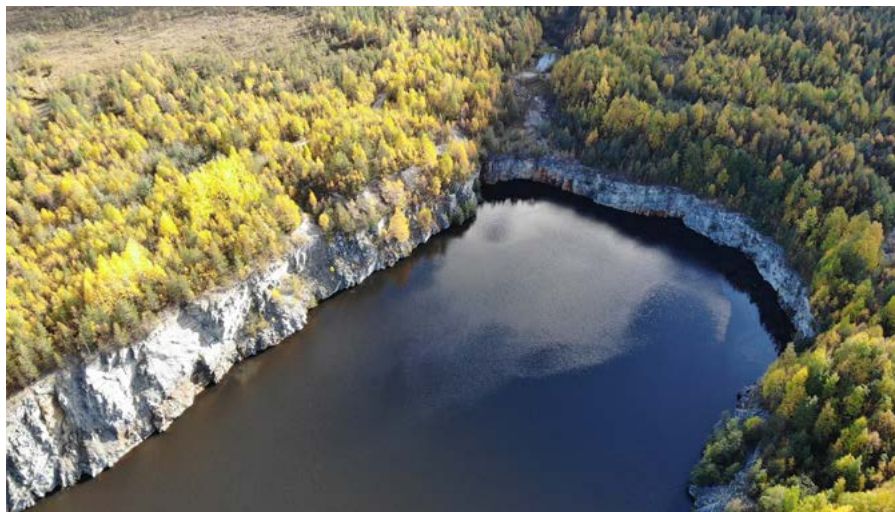
↑ Северная природа не настолько сурова, как кажется

Вы прибудете на одноименную базу, которая выполняет и роль образовательного туристического центра. Таких локаций в этом регионе несколько.