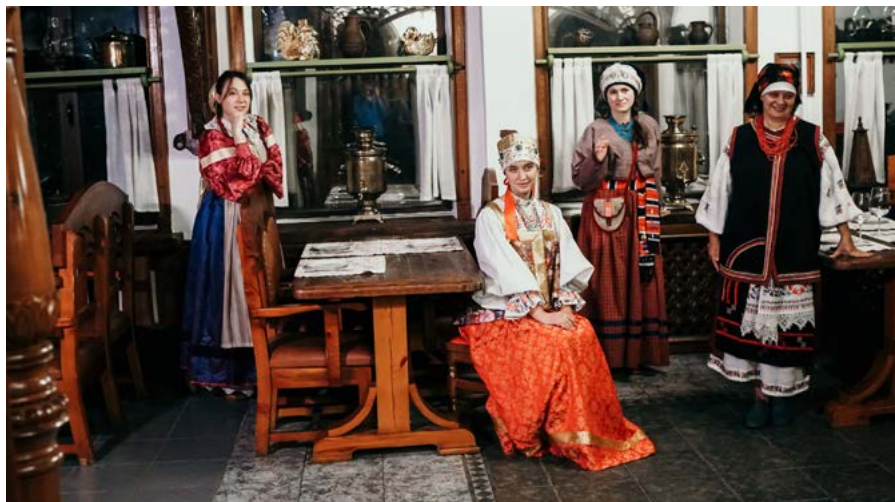
↑ Национальная одежда алтайцев и красива, и функциональна

как трофей один из русских солдат, встречавший май 1945 года в Берлине. Еще тут можно увидеть находки из курганов Алтая и коллекцию петроглифов III-V вв. до н.э., черепа бизонов и мамонтов, китайский фарфор, письменный стол и личные вещи писателя-натуралиста Виталия Бианки.