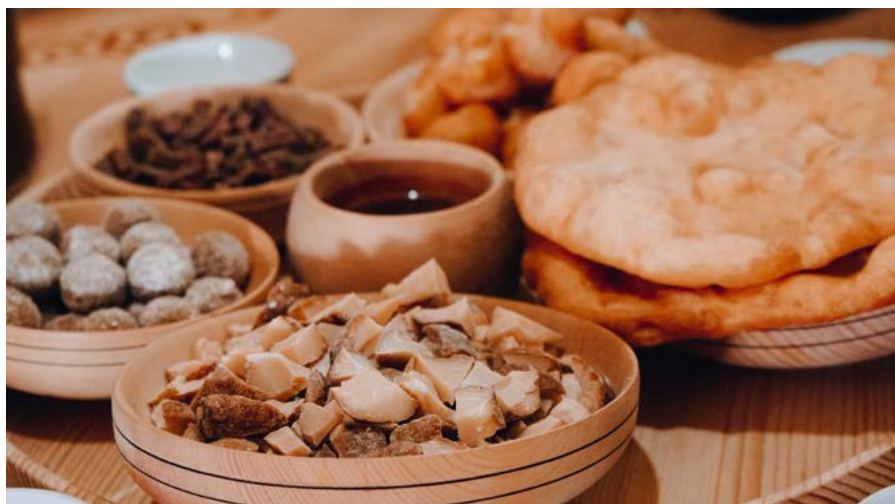
↑ Традиционные блюда алтайской кухни: простые и сытные

поэтому хорошо видны сталактиты. Однако, кое-где придется идти гуськом, подниматься по козьей тропке вверх или ползти метров десять на четвереньках, поскольку свод каменного коридора не превышает метра.