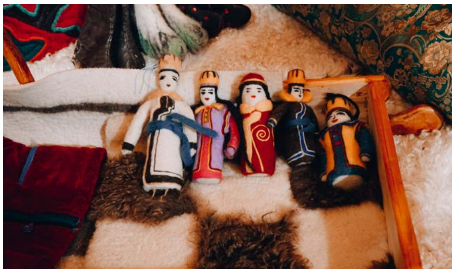
↑ С Алтая невозможно уехать без аутентичного сувенира

открывается прекрасный вид на речную пойму и город.