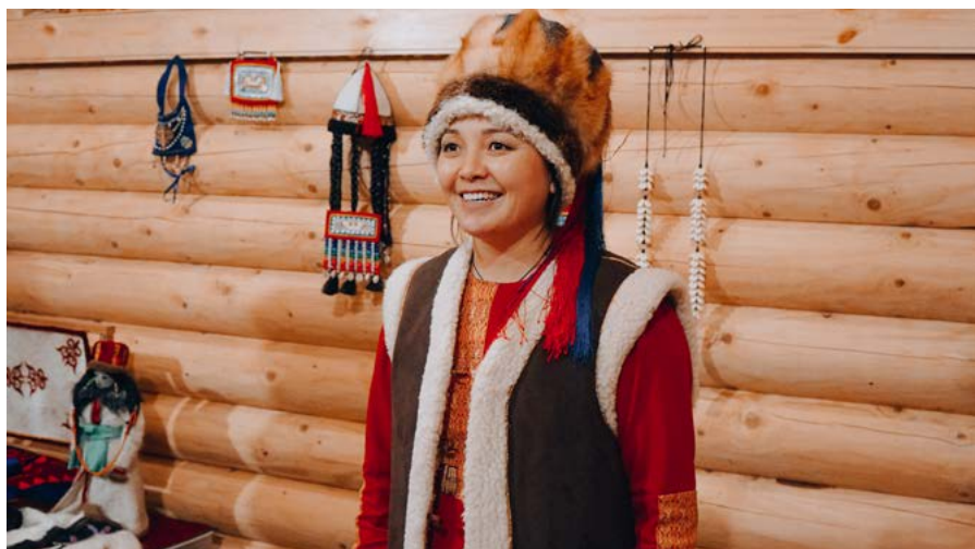
↑ В гостях у настоящих алтайцев в этнокомплексе «Алтайский аил» в Горно-Алтайске

из 30 карстовых пещер в скалах, возвышающихся над Катунью. За тысячелетия древнее море вымыло в местных породах систему ходов, связанных в гигантский лабиринт.