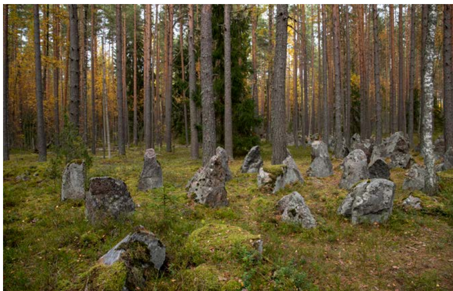
↑ Остатки линии Маннергейма: заградительные каменные валуны

по тропам вдоль озера к камню, который за форму называют «разбитым сердцем». Под ним образовалась естественная пещера, в которой воображение сразу рисует первобытных людей вокруг костра. Для вас тут уже будет гореть костер, для дегустации будет приготовлено мясо диких зверей. Полное ощущение себя в доисторическом времени!